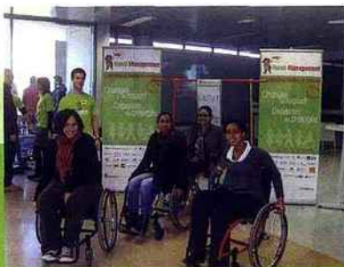
Mise en situation