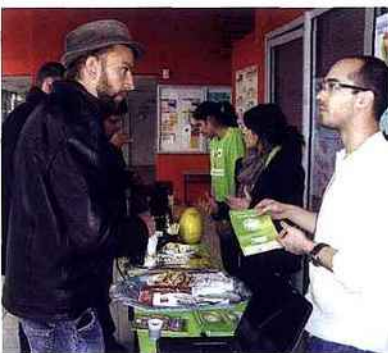
Stand « petit déjeuner » d'inscription

Tout d'abord, je me suis rendu compte de ma méconnaissance sur le thème du handicap en entreprise. J'ai même éprouvé une certaine honte en m'apercevant que je possédais plusieurs idées reçues totalement fausses. En effet, pour moi, le handicap était quelque chose qui empêchait une personne d'être professionnellement très productive, et que l'intégration de des personnes handicapées était extrêmement contraignante pour les entreprises. Cette semaine a donc radicalement changé ma vision des choses.