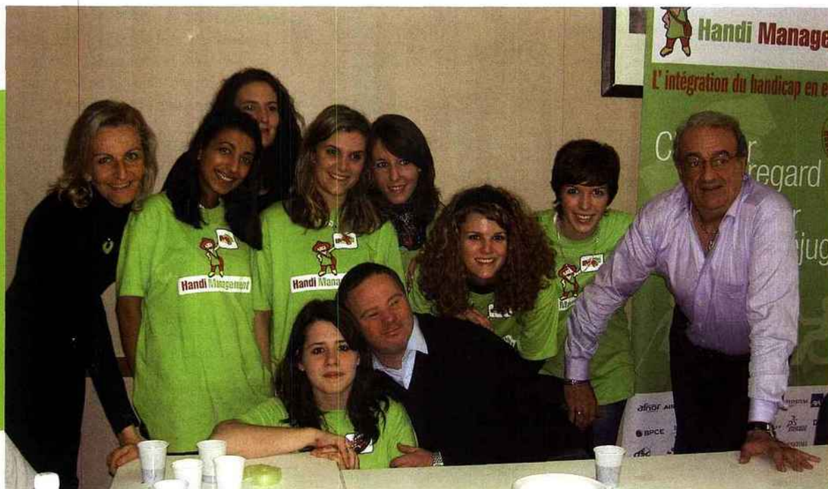
Rencontre avec l'acteur Pascal Duquenne