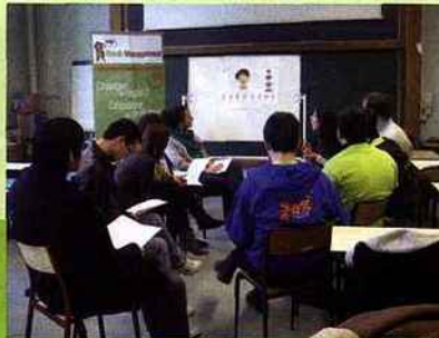
Il faut d'abord comprendre