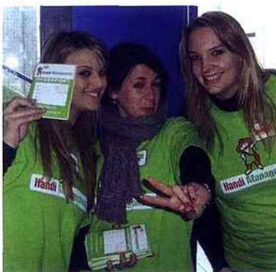
J'ai mon passeport !