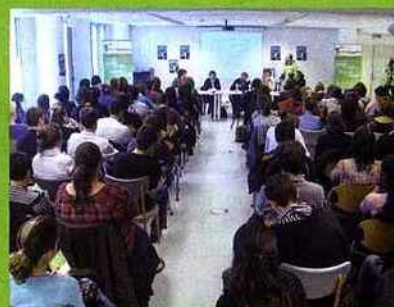
Conférence à l'UPMF